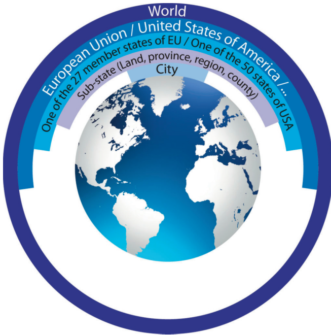
Figuur 3: Schematisch overzicht van een mondiaal herverdelingsinstrument 19

ongenuanceerd is. Als inwoner van Gent geef ik wat vissen aan de stad Gent, die worden herverdeeld onder de inwoners van Gent; ik geef wat vissen aan Vlaanderen, die worden herverdeeld onder de inwoners van Vlaanderen; ik geef wat vissen aan België; en nog een klein visje aan Europa. Ik pleit niet voor een wereldwijd herverdelingsinstrument dat al die bestaande instrumenten vervangt, wel voor een extra laag op mondiaal niveau, zoals de figuur hieronder illustreert.